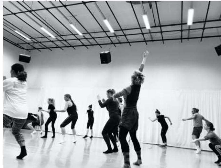
Workshop SITcompany (US) 2.-7.12.