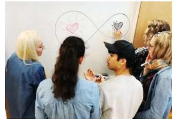
Mentoringprogram: Sluttsamling 3.6. for 4. kull i mentoringprogrammet.

Frilanstreffet arrangeres hvert halvår for scenekunstnere og andre i bransjen som et uformelt møtested med et faglig fokus. Vi fortsatte vårt samarbeid med Heddadagene