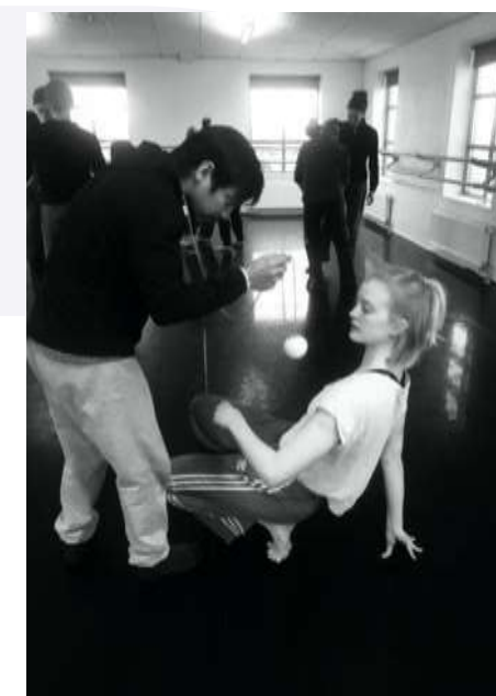
Workshop: Inspired by Fighting monkey (PL) 11.-15.3.