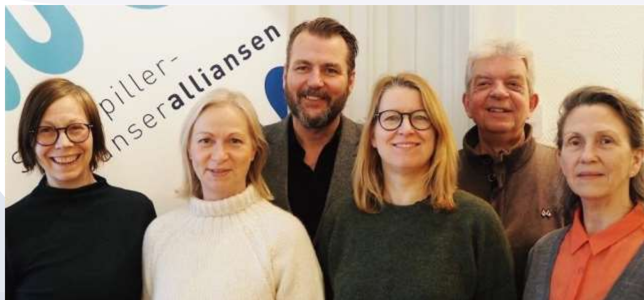
SKUDAs styre valgt 25.4.