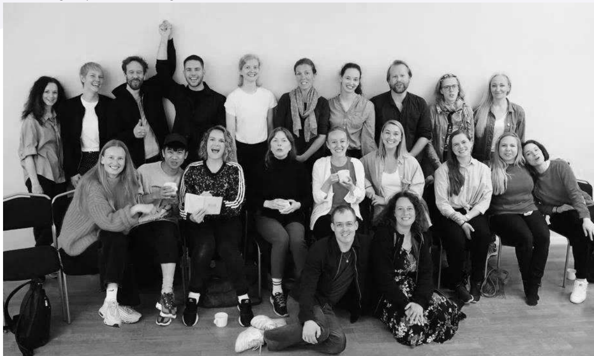
Mentorer og adepter i sluttsamling 3.6.