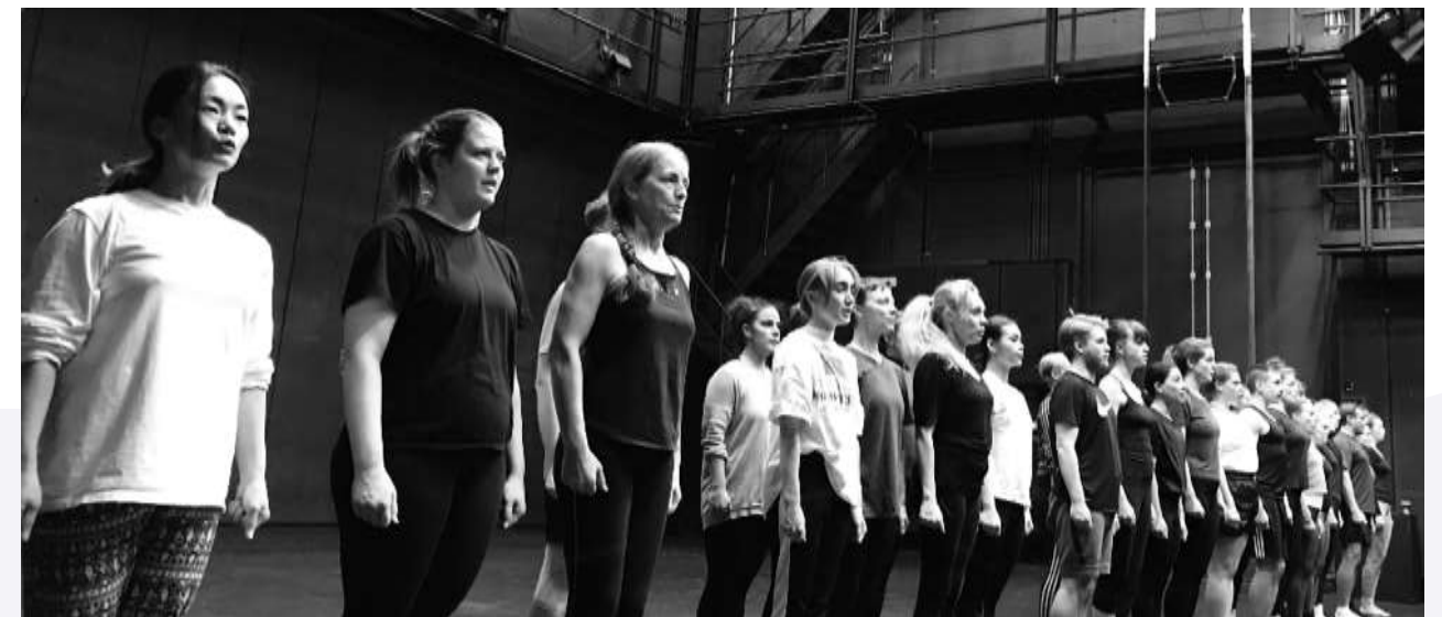
Workshop med SITI company fra New York. 7.12.