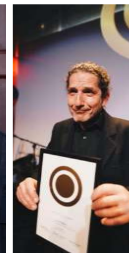
Jan. Holden Foto Screen Media