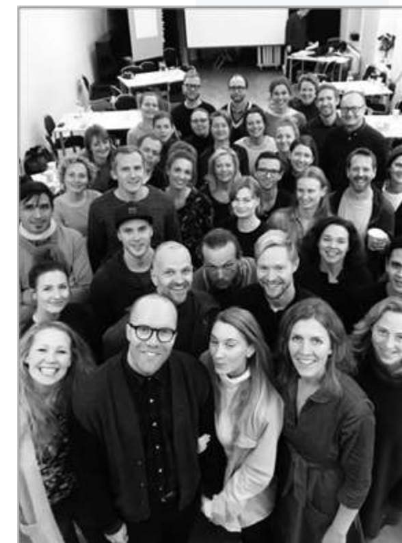
Personalmøte desember 2018

Skuespiller- og danseralliansen ble 1.7. medlem i Norsk Teater- og orkesterforening.