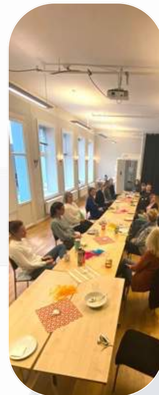
Lunsj i fagfelleskapet i Welhavensgate 1 med Norsk Skuespillerforbund, Norske Dansekunstnere, Skuespiller- og danserealliansen og Norsk Skuespillersenter

Regnskapet er ført internt. Revisjon er utført av BDO ved revisor Steinar Andersen.