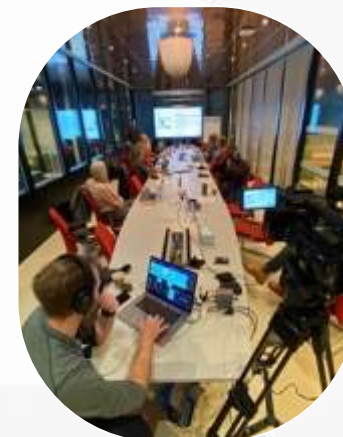
Fagprogram i Oslo under Showbox festivalen med fokus på markedsføring