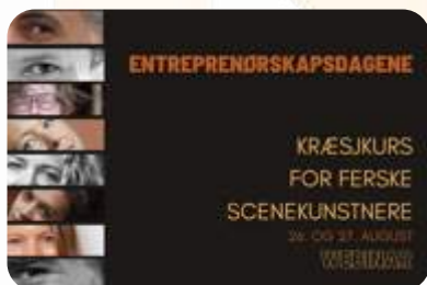
Webinar i samarbeid med PRODA, NSS og MTF for nyutdannede scenekunstnere

SKUDA har jevnlig kontakt med Dansalliansen, TeaterAlliansen og Musikalliansen i Sverige.