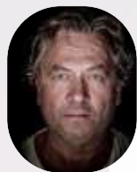
Nils Petter Molvær