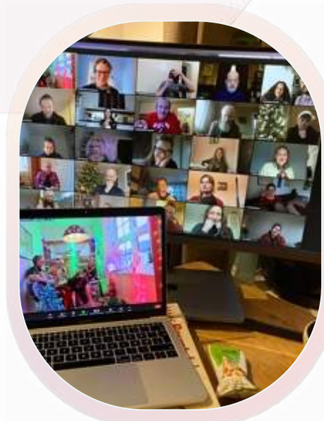
Digital julebordsamling med alle ansatte i Skuespiller- og danseralliansen

Flere av Skuespiller- og danseralliansens ansatte kunstnere har mottatt arbeidsstipend fra statens kunstnerstipend, eller koronarelaterte stipend. Ved arbeidsstipend, stipend for etablerte kunstnere eller andre langvarige stipend har kunstneren redusert stilling i SKUDA. SKUDAs lønnskostnader reduseres tilsvarende, og dette medvirker til at flere kunstnere kan ansettes.