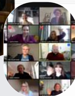
Mentor- & adeptsamling avholdt digitalt