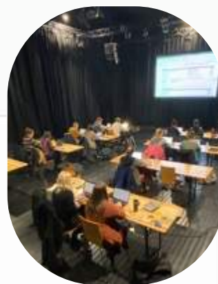
Excel workshop under fagprogrammet i Trondheim