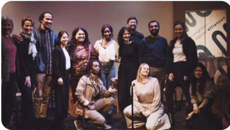
Bransjesamtalen 18.11. med temaet Mangfold på scene, lerret og skjerm – en bransjesamtale om arbeidsmarkedet for skuespillere med minoritetsbakgrunn.