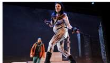
1 av 4 scenekunstnere har opplevd diskriminering på grunn av barn eller graviditet Og mange flere er redde for hva familjelivet vil gjøre med karrieren.

ELLIS - Et langt liv i scenekunsten - et nettverk for erfaringsutveksling og kompetanse, gjennomfører to arrangementer i året. I 2021 var det fokus på Covid året som var gått og det å være foreldre og kunstner. Sistnevnte var en stor undersøkelse som fikk 240 respondenter etterfulgt av seminar. I tilknytning til dette ble to av våre ansatte dansere intervjuet i CREO sitt magasin Kontekst. Undersøkelsen ble også omtalt i Skuespillerforbundets Stikkordet.